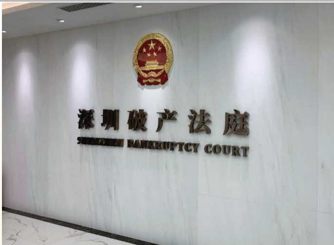
全国首个独立运作的破产专门审判机构——深圳破产法庭

自2021年7月个人破产“全国第一案”裁定生效以来,这一制度在深圳试点运行已有4年。不过,公众对其还难免有些误解,最突出的,莫过于担心个人破产制度是为“老赖”撑腰,有违“欠债还钱,天经地义”的古训。那么,为什么允许个人破产?个人破产制度又当如何平衡债权人和债务人的利益,完善配套安排?