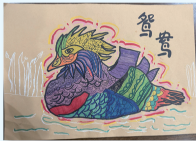
北城小学二(27)班 郭修琦 指导老师 姜楠