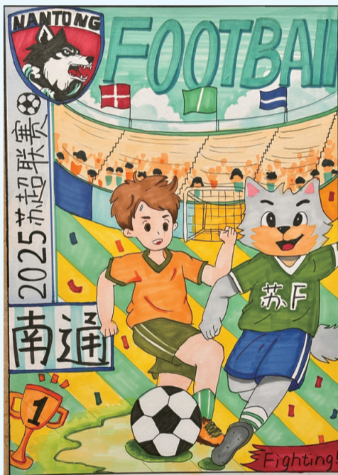
北城小学二(4)班 邵泽宥 指导老师 高迪