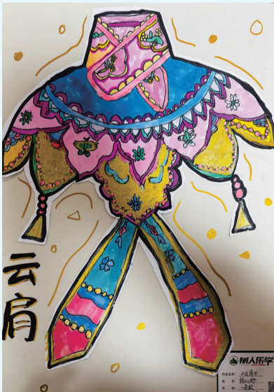
北城小学二(27)班 杨心好 指导老师 姜楠