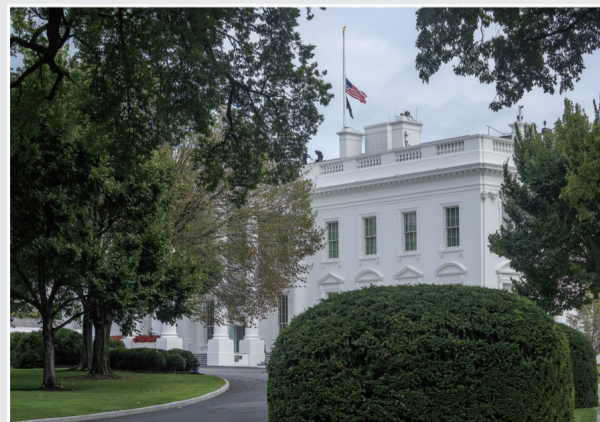
10日,美国首都华盛顿白宫降半旗志哀。

不过,据美国有线电视新闻网报道,特朗普13日接受美国福克斯新闻数字网采访时,肯定了帕特尔和FBI在柯克遇刺案中的表现。 袁原