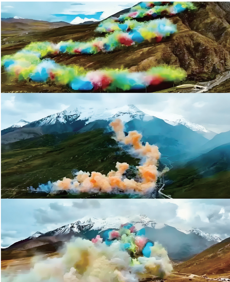
现场视频显示,蔡国强通过火药爆破在山脊点燃三幕烟花,形成“升龙”动态景观。

植物学家顾有容说,当地土壤结构不稳定,地表仅覆盖10厘米左右的草毡层,由密集交织的草根与有机质构成,起到固碳、保水和防止风蚀的作用。草毡层下方是