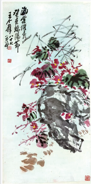
图为展出的南通籍名家王个簃的《海棠图》。