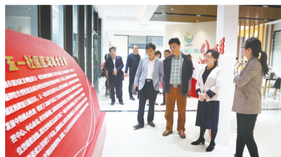
调研“政协委员之家”建设