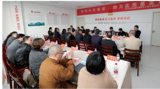
协商民主监督聚焦生态建设