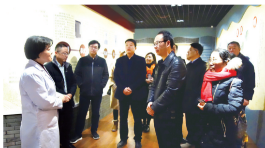
调研中医药事业发展情况

此外,区政协常委会还研究出台《关于加强和改进人民政协民主监督工作的实施办法》,进一步完善民主监督的组织领导、权益保障、知情反馈、沟通协调等机制。牵头抓好污染防治等领域的民主监督工作,组织“三代表一委员”对全区空气质量、水环境、“散乱污”企业、环境信访等工作进行了20余次督查视察及专题会商,促进全区污染防治工作有力推进。“沿江地区生态优先、绿色发展”协商式民主监督相关经验在政协常委会上交流推介。和平桥街道政协工委就环境整治工程推进、社区网格化管理机制优化等工作开展民主监督。