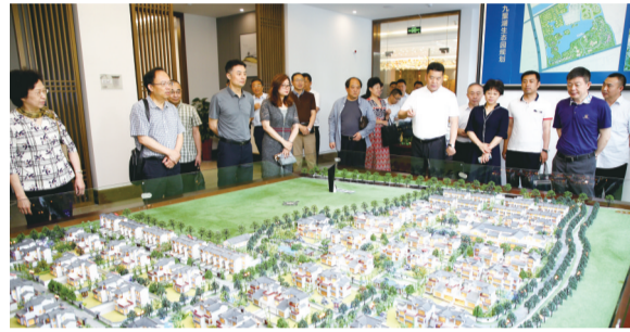
建言献策招商引资