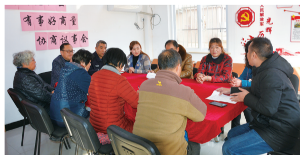
“有事好商量”协商议事会