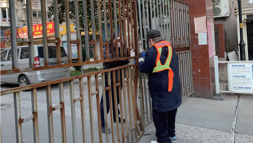
外滩小区方天物业的工作人员封闭小区东大门。

川区疾控中心的工作人员便对包括8名乘客和2名司机在内的10人进行了流行病学调查,并将乘客居住信息等通报相关县(市、区)。“对从武汉返通人员、密切接触者的筛查越早越好,这样才能有效切断传染路径。”崇川区卫健委副主任李林介绍。面对严峻的疫情形势,崇川区在全市最早提出将温州作为重点疫区进行人员排查,2月2日起将温州来崇川的人员进行居家隔离,并在第一时间对南通县(市、区)确诊病例重点镇街(园区)的来区人员开展细致摸排。