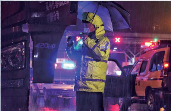
2月14日深夜,沈海高速兴仁收费站交通查控点,民警正在冒雨开展工作