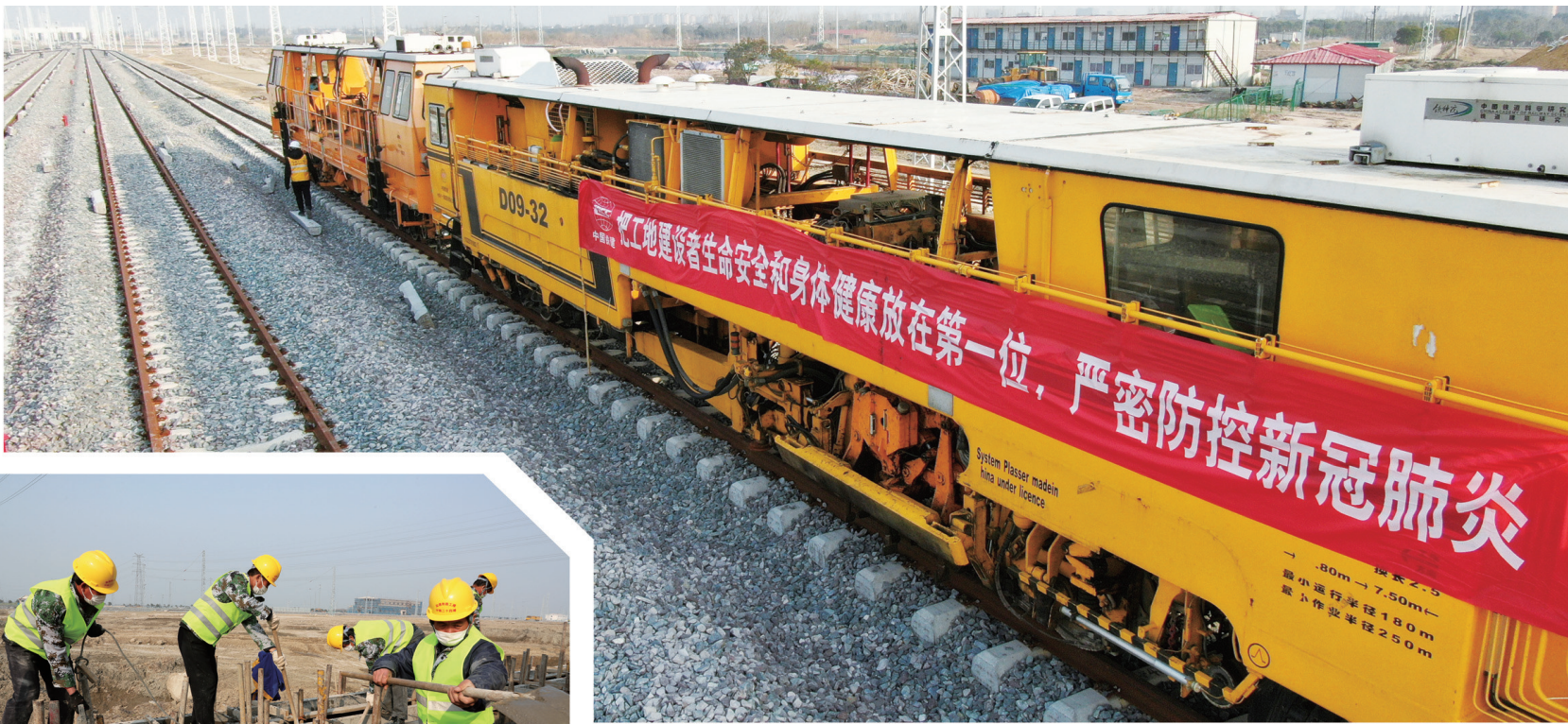
昨天，位于港闸区幸福街道辖区的高铁动车所全面复工。根据上级部门及地方政府的要求，中铁十一局、中铁二十四局和中铁建工配备防疫人员、物资，严格执行复工防疫措施，做到防疫、复工两不误。