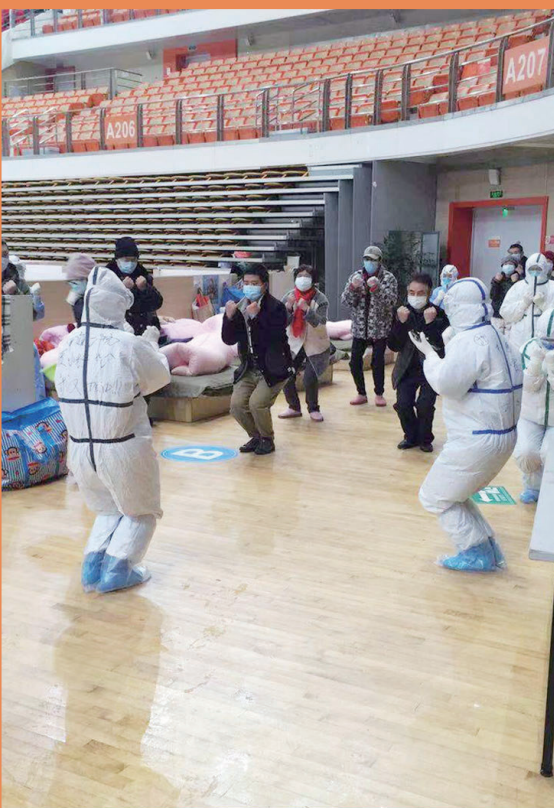
南通医疗队队员在武汉体育中心方舱医院工作