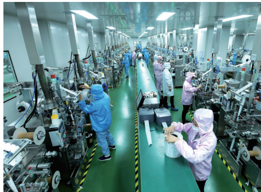
昨天，欧凯包装科技有限公司正在加紧生产定制的外控型食品保鲜剂。

上周，南通双弘纺织有限公司引进“热成像体温筛查”新技术，员工进入厂区1秒就能测温。1300多名员工原本手工测温耗时2个小时，现在只需30分钟。