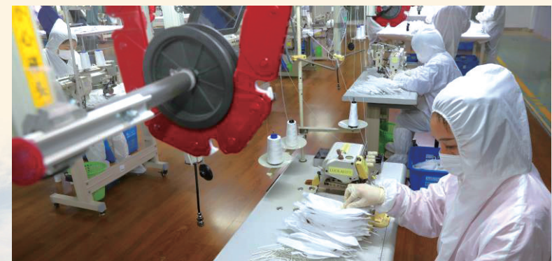
罗莱生活改造生产线,生产口罩支援防疫。