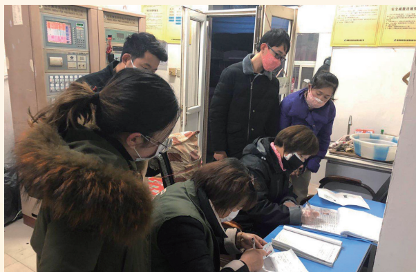
星海街道星嘉社区为底商复工人员办理登记手续。