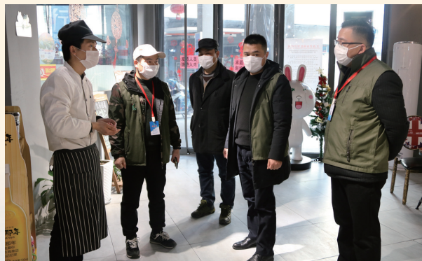
竹行街道星怡社区工作人员指导门店安全复工。