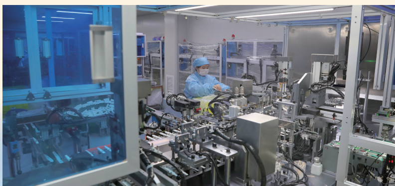
工作人员在江苏南通伊仕生物生产车间忙碌。