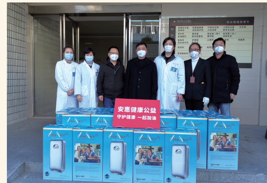
安惠生物为市相关医疗机构捐赠空气消毒机。