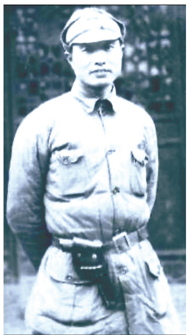
革命年代的张爱萍