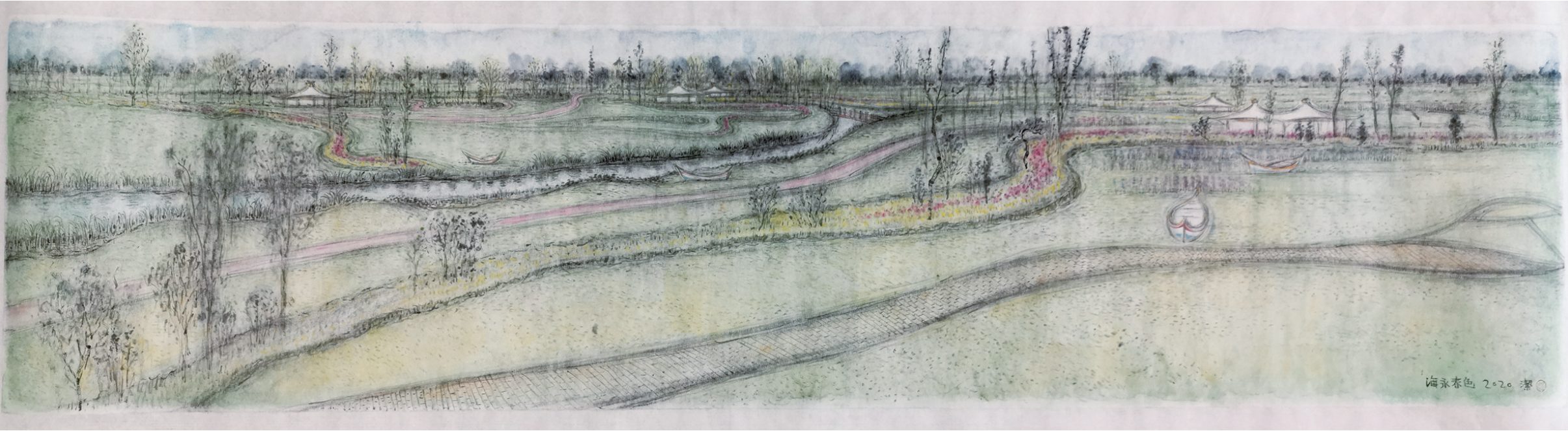
海永春色 绘图赵潜

奥伦达部落的面目渐渐清晰，在这块由梦想博物馆、特色餐厅、房车、民宿组合而成的缤纷部落中，一个个城市旅人风尘仆仆抵达，神清气爽归家。奥伦达，亦如海永这个隐秘的诗意小镇，正在梦中朝你款款而来。