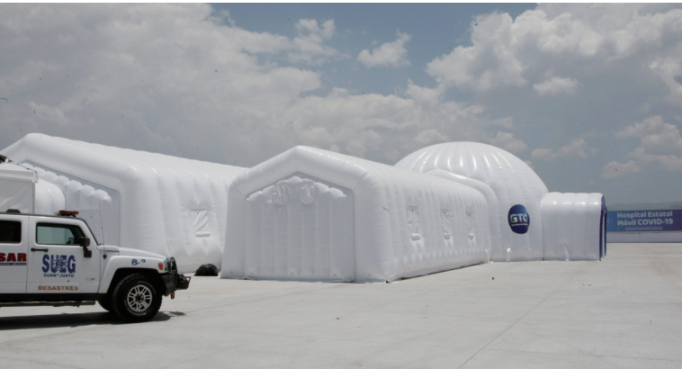
当地时间17日,在墨西哥瓜纳华托州莱昂市,为应对新冠疫情而建设的“充气医院”正式投入使用。据当地媒体介绍,该医院占地约2500平方米,配备空调及各种医疗设备。

据新华社日内瓦6月17日电 世界卫生组织17日宣布停止其“团结试验”项目中羟氯喹分支试验,理由是该药物未能降低新冠患者的死亡率。 世卫组织当天发表声明说,“团结试验”中的研究人员将不再随机分配患者到羟氯喹分支,已经开始服用羟氯喹但在试验中尚未完成疗程的患者,可在监督医师指导下完成疗程或停止服用。 世卫组织“团结试验”项目旨在比较几种不同药物或药物组合治疗新冠肺炎的安全性和有效性,以尽快找到有效治疗方法。 同日,世界卫生组织对英国研究团队近期有关地塞米松治疗新冠患者的积极成果表示欢迎, 但同时也警告称,该药物不应用于新冠重症患者或用于预防。 世卫组织总干事谭德塞在17日的例行记者会上对这一研究成果表示祝贺。他证实,根据世卫组织收到的初步研究结果,对于使用呼吸机的新冠重症患者,地塞米松能将死亡率降低约三分之一;对需要吸氧的患者,可降低死亡率约五分之一。 谭德塞表示:“对于那些病情严重的患者来说,这是一个非常受欢迎的消息。”但他同时强调:“地塞米松被证明对那些病情较轻、不需要呼吸支持的患者没有什么好处。” 他还表示,英国的研究结果虽然意义重大,但仍只是初步数据,世卫组织要看到最终数据,才能更新其临床指南并支持各国以尽可能适当的方式获取和使用该药物。