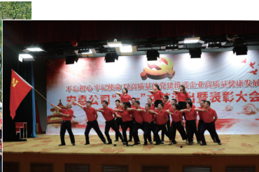
安惠公司“七一”文艺演出暨表彰大会举行