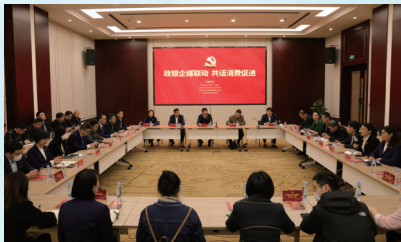
政银企媒联动，共话消费促进