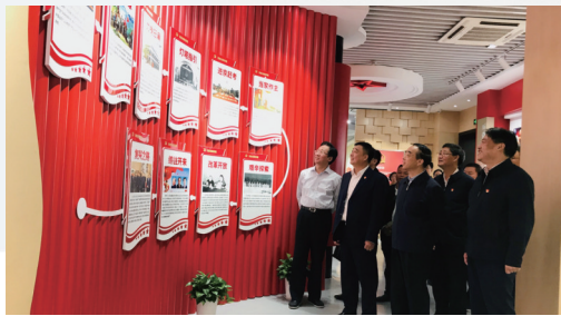
省委巡回指导组来安惠检查指导主题教育开展情况

在生机勃勃的安惠园，党组织是战斗堡垒，党员是模范标杆，用无声的行动影响，带领员工心往一处想，劲往一处使，推动安惠事业稳健前行，高质量发展。安惠，已成为国内外食药两用菌界和直销业有影响力的知名企业，为健康中国、发展经济、惠及民生做出了应有的贡献。