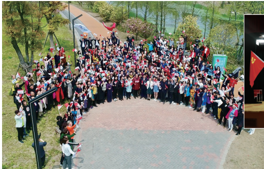
与时代同行 为祖国点赞 安惠人一起唱响《我和我的祖国》

安惠常态化开展各类文体特色活动，与国旗同框，为祖国祝福，集体向祖国“表白”，用最美好的歌声，最优美的舞姿，最昂扬的激情为伟大的党献上最诚挚的祝福，强化宗旨意识教育，展示党建工作成果。为此，安惠先后获得南通市民营企业文化建设示范单位，南通市十大员工幸福示范民营企业，全国模范劳动关系和谐企业，全国模范职工之家等荣誉。