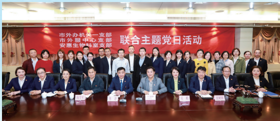
安惠科室支部与南通市外办两支部开展主题党日活动

各党支部认真开展重读入党志愿、重温入党誓词、重忆入党经历、重问入党初心，推动党员亮身份、服务亮承诺、工作亮标准、担当亮作为。100名党员，100面旗帜，强本领，带好头，有作为，为安惠“四五”发展贡献智慧和力量。