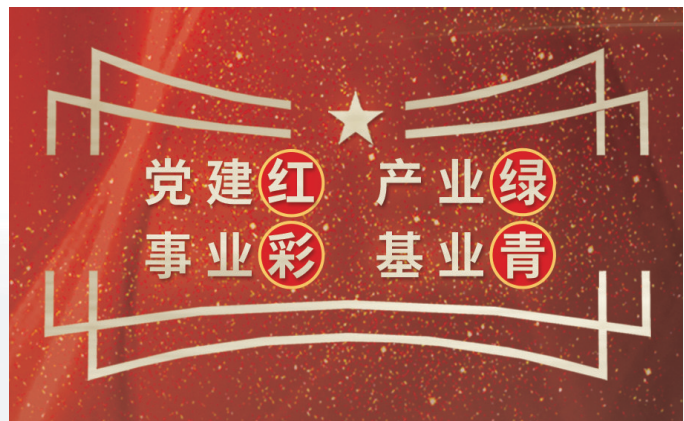
党建“红”引领产业“绿”、事业“彩”、基业“青”