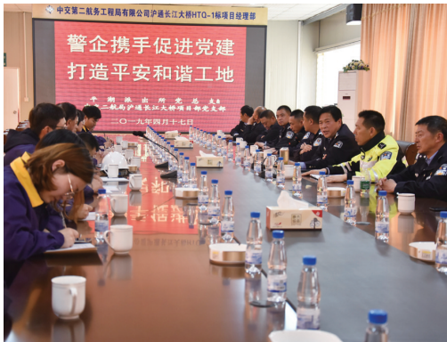
平潮派出所与重大项目建设单位进行党建联姻