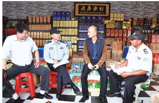
民警在辖区走访民情

通过主动融入、主动对接、主动作为，市公安局属派出所和有关部门积极联合当地党委政府和重大项目单位开展风险评估，超前预警和处置有可能影响项目建设的各类治安问题和社会矛盾，把服务保障工作项目化推进，责任化落实，实现警力全覆盖、工作无缝隙、服务零距离、管理无漏洞，切实为平潮高铁新城的沪苏通长江大桥等各个重大项目建设创造出优质的治安环境，提供更多、更优的警务服务，确保重大项目建设无障碍推进。