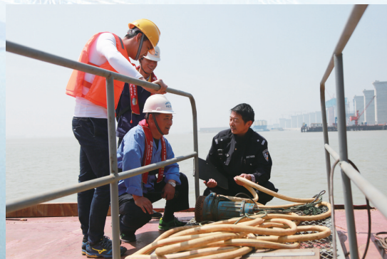
民警在沪苏通长江大桥建设工地检查安全工作