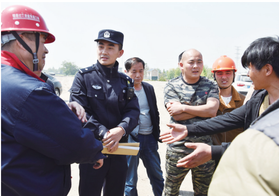
民警在建筑工地现场调解矛盾纠纷