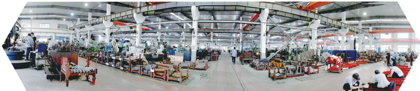
▲江苏如通石油机械股份有限公司生产车间