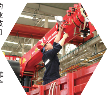
►三一帕尔菲格特种车辆产销两旺