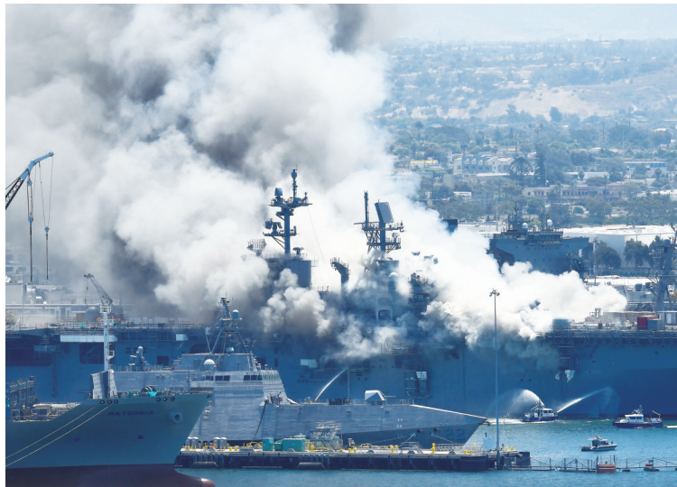
7月12日,美国加利福尼亚州圣迭戈海军基地起火冒出浓烟。停泊在加利福尼亚州圣迭戈海军基地的一艘美军两栖攻击舰12日发生火灾,造成包括17名海军士兵在内的21人受伤。

近日,根据网民举报,国家网信办针对“学而思网校”APP存在低俗视频、教唆早恋内容等突出问题,指导北京市网信办会同属地教育主管部门,依法约谈网站负责人,责令限期整改,完善信息安全制度,加强内容审核,切实落实主体责任。