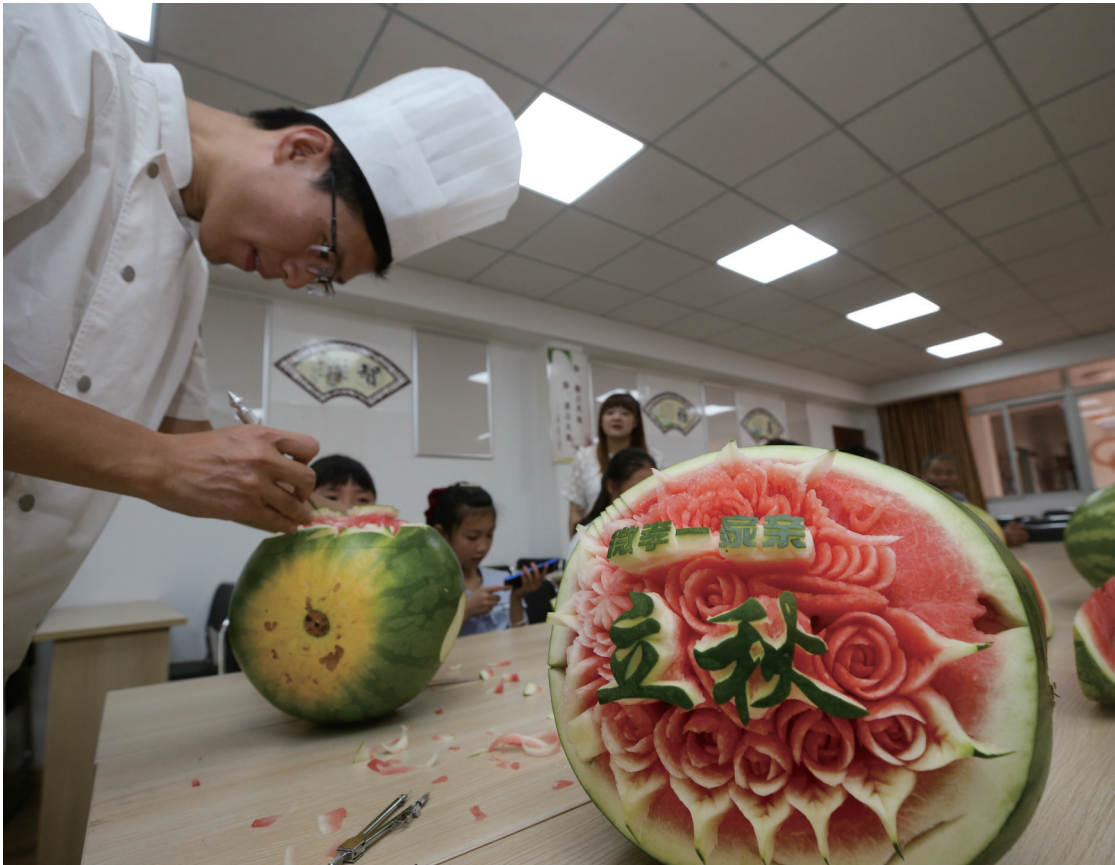
昨天，为迎接“立秋”节气到来，崇川区天生港镇街道通隧社区举行“刻廉品瓜迎立秋”活动，社区党员、民间河长、青少年等近30人在志愿者指导下体验西瓜雕刻技艺，同时感受廉政文化和民间“啃秋”习俗。

对于电动车能否加装车篷问题，《江苏省电动自行车管理条例》也有明确规定，任何单位和个人不得在电动自行车上加装车篷、车厢等改变外形结构影响行驶安全的装置。根据《江苏省电动自行车管理条例》第四十条规定，驾驶超过使用年限或者拼装、改装、加装的电动自行车上道路行驶的，由公安机关交通管理部门扣留车辆，处二百元罚款；加装、改装的，责令恢复原状；拼装的电动自行车由公安机关交通管理部门予以收缴。