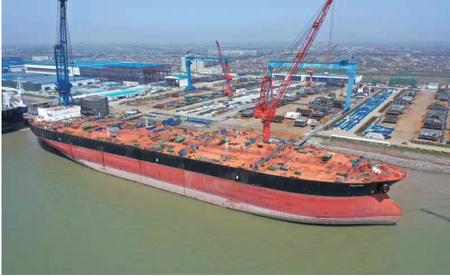
启东中远海运公司正在改装的30万吨级油轮“猎鹰号”,是目前长江北支停靠吨位最大的船只,这艘巨型油轮将在中远公司经过两年的改造,升级成世界上最大型浮式生产储卸油平台。