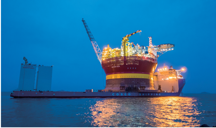
启东中远海运公司的“希望6号”,该产品“多点系泊圆筒形浮式生产储卸油平台(FPSO)关键技术研发与应用”荣获2019年江苏省科技进步一等奖。