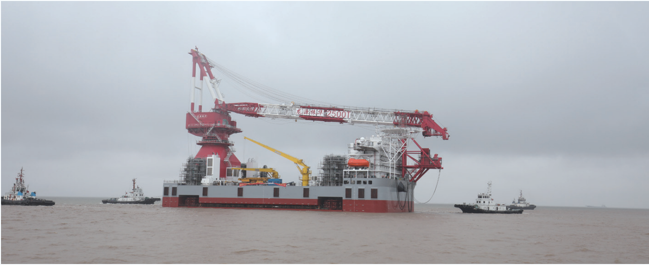
启东振华公司的2500T新型自升式风电安装船,是目前亚洲最大的风电安装船。