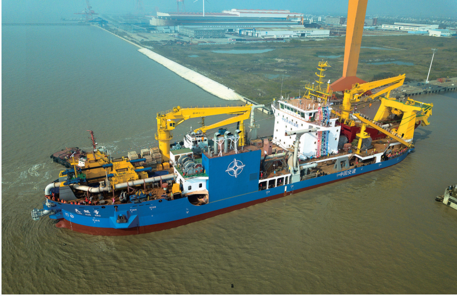
启东振华公司的“天鲲号”,荣获2019年度国家科技进步特等奖。

计划新开工总投资30亿元的京沪重工年产25万吨智能绿色特大跨径桥梁生产基地扩建项目、总投资20亿元的红通机械核电(风电)装备制造一期项目等重大项目2个。 计划新竣工振华海上风电及海工钢结构制造项目、筑城现代建筑产业基地项目、大正海工装备配套制造基地等项目3个。 计划新转化中远模块制造项目、京沪钢结构桥梁生产配套设施技改等项目2个。 计划盘活存量土地1500亩。