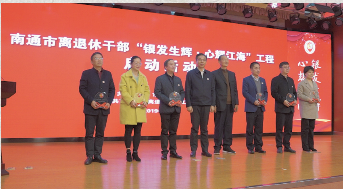
“银发生辉·心耀江海”工程启动仪式