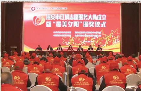
海安市成立老干部红枫志愿服务队