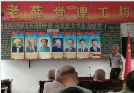
海门区老薛党课工坊