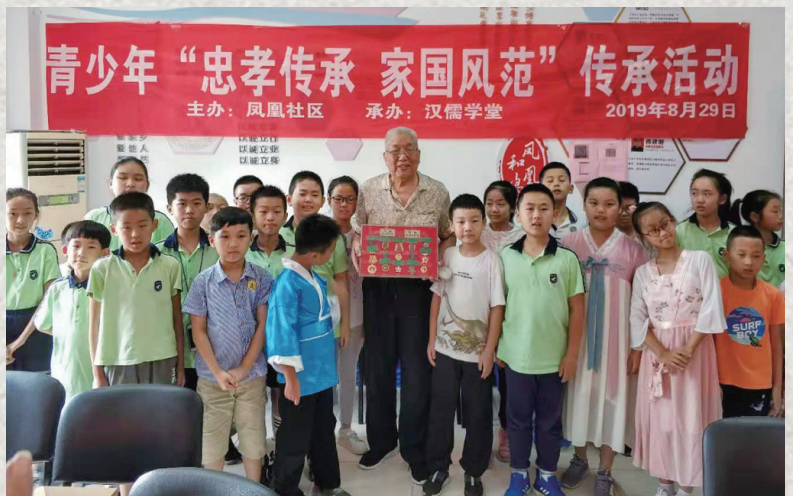
老干部助力优秀文化传承