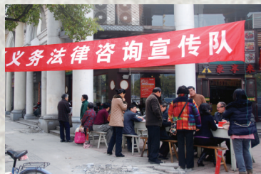
红旗扬志愿者助力社会治理