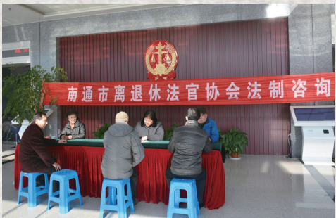
市老法官协会提供法律咨询