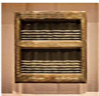
周懋琦制作的子玉算盘