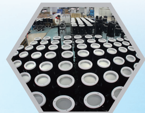
南通斯密特激光光电科技有限公司成为全球最大的天文望远镜生产基地