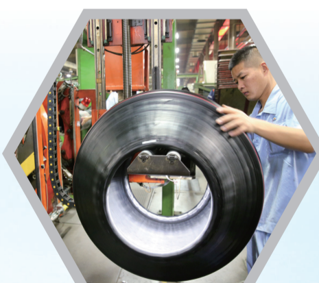
双钱集团江苏轮胎有限公司精益化生产做大做强