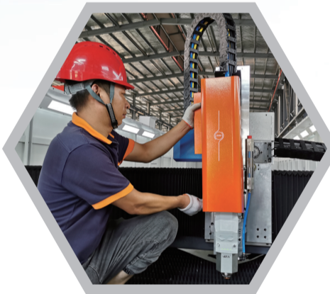
江苏讯发激光科技有限公司今年满负荷生产

龙头型、基地型重大项目接踵而至,厚植产业“强大基因”,得益于如皋紧紧围绕智能装备制造、高端新材料、新一代信息技术、光电及第三代半导体等五大制造业产业和现代物流、生态旅游等两大服务业产业,全面推进“云招商”模式,开跑即冲刺,开战即决战。对标苏南、跨江融合的前沿区域,如皋推动产港城深度融合,打造产业发展新高地,招来一个个重大项目。