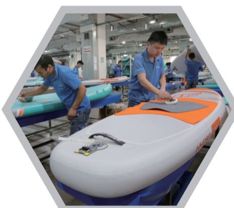
南通荣威娱乐用品有限公司打造全球最大的时尚休闲产业基地

集聚创新资源,致力协同创新,构筑高质量产业体系,实现高质量发展,如皋健全“六位一体”科技人才服务体系,加快双创中心、开发区科创中心等公共平台建设,加快引进亿元以上科创型、领军型项目,全年实施产学研项目150个以上,净增高新技术企业30家、省级企业研发机构5家、PCT国际专利50件。