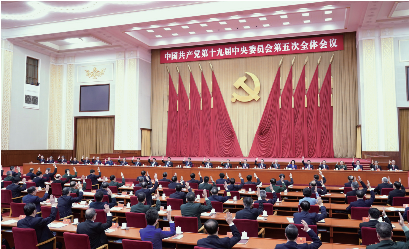
中国共产党第十九届中央委员会第五次全体会议，于2020年10月26日至29日在北京举行。中央政治局主持会议。

新华社北京10月29日电 中国共产党第十九届中央委员会第五次全体会议公报(2020年10月29日中国共产党第十九届中央委员会第五次全体会议通过)