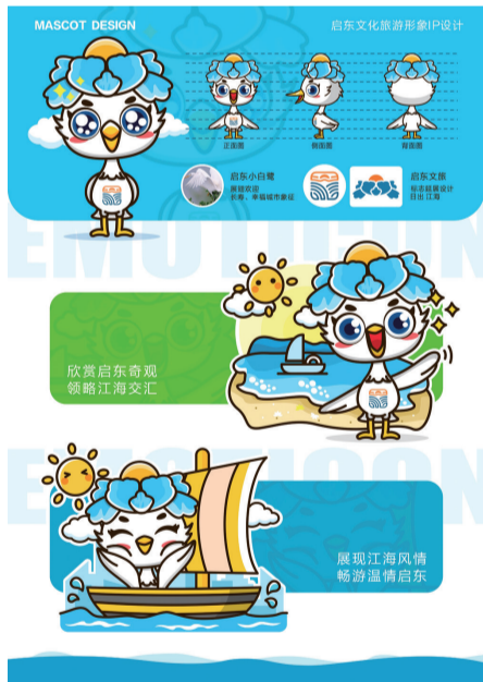
09 “启东小白鹭” 作者 梁 靖