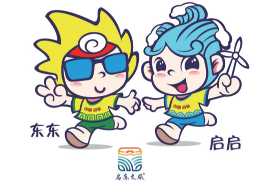
05 “东东”“启启” 作者 张明远