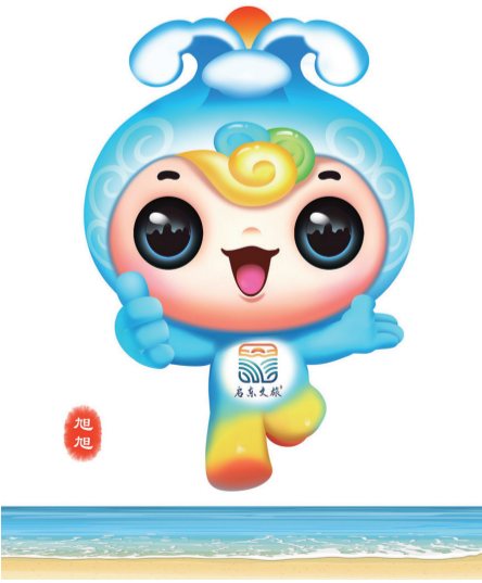
11 “旭旭” 作者 肖冰