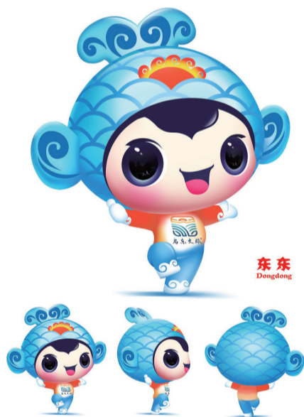
10 “东东” 作者 刘俐俐