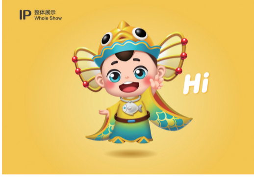
15 “淼宝” 作者 庆邦传媒