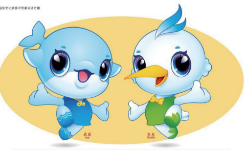
14 “启启”“东东” 作者 苏州微云创智文化传播有限公司