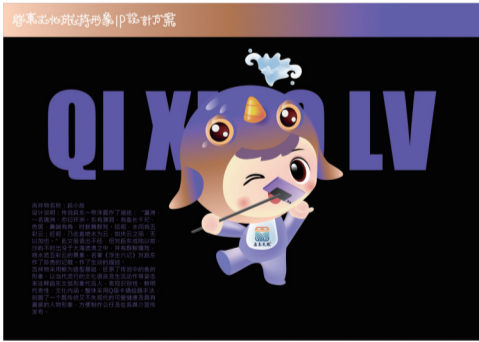
04 “启小旅” 作者 朱江