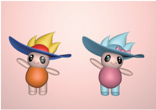
01 “东东”“圆圆” 作者 曹舒婷