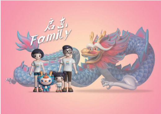
02 “启东Family” 作者 扬 泱