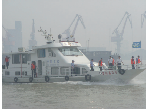
南通水利、公安、海事、长航公安联合开展执法行动