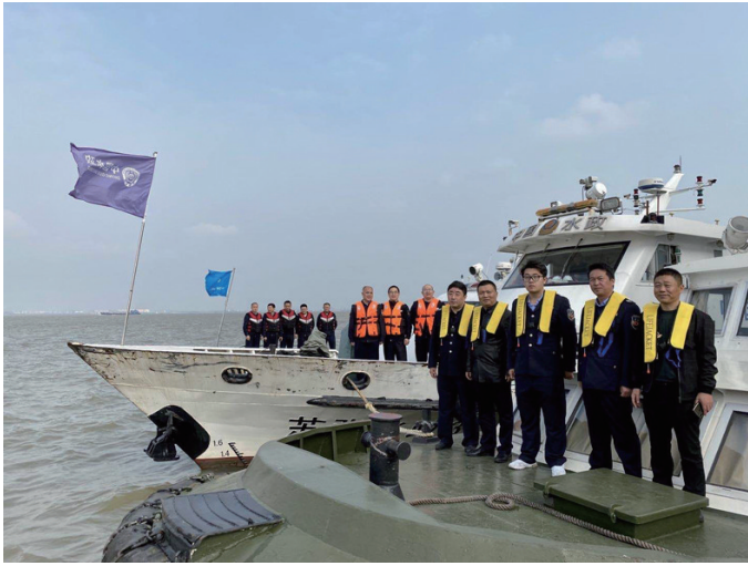
南通如皋组、苏州张家港组、泰州靖江组会师于长江水域50号浮