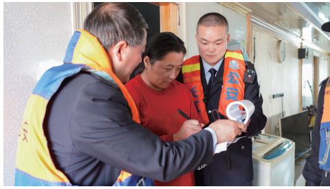
向运砂船主宣传省政府禁采公告