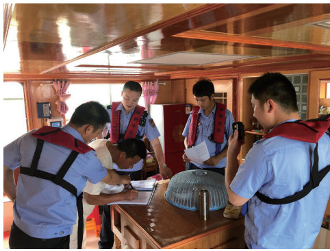
水政执法人员登船检查

《关于做好疫情防控期间长江河道采砂管理工作的通知》《关于加强汛期水行政执法和长江水域禁止采砂工作的通知》等文件,通过发文、发函、组织专项行动等方式,进一步强化各地长江禁采和扫黑除恶主体责任的落实。围绕治理体系中部门责任落实,印发《关于分解落实全市长江水域禁止采砂重点工作任务的通知》至各成员单位,明确时间节点,明确责任单位。各成员单位围绕职责分工,突出重点,细化举措,形成长江水域禁采工作方案;在深化市级联合执法机制的基础上,搭建县际联动执法平台,强化边界水事案件协调查处,进一步提高了打击边界水域非法采砂效率。