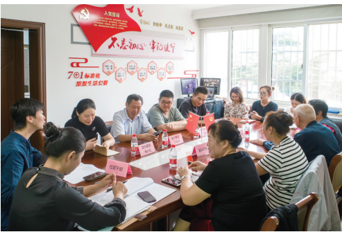
永兴街道越江社区“有事好商量”协商议事室内,政协委员、群众代表、社区干部就“公共车库智能升级,破解老旧小区电动车充电安全”顽疾’面对面协商。