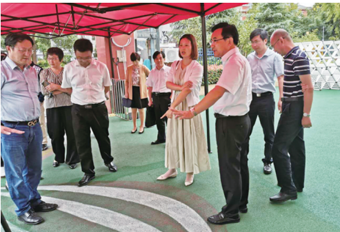
有事好商量民生月,区政协党组书记、副主席镇海洋调研学前教育。