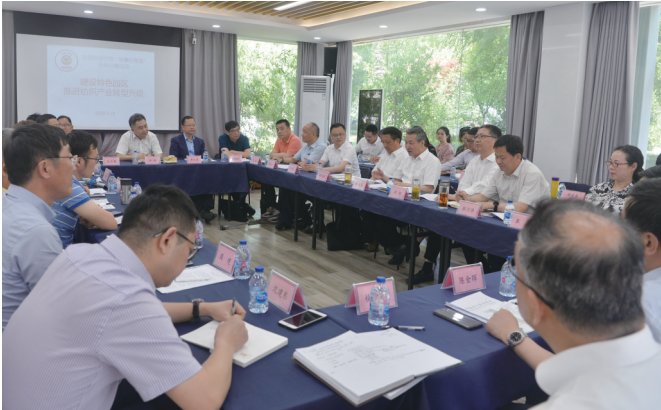
协商议事活动现场

协商人员:省政协委员2名,市政协委员7名,部门负责人8名(含通州湾示范区分管领导1名),企业负责人6名,行业专家2名,共25名。市政协主席黄巍东以省政协委员身份参加活动。