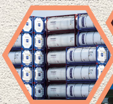
▼ 2018年销售额突破40亿元

了成熟的研发和制造模式，在多元化业务发展的布局中，打造出了丰富的产业链优势，抗风险能力进一步增强，在全价值链职能领域塑造出立足行业、不畏风险的核心竞争能力。市场拓展遍布欧洲、美洲、亚洲等地发达国家，并逐步覆盖南美洲、东南亚、中国等新兴经济体；欧洲技术公司、研究院，有着行业最前沿的技术研究和储备，前瞻性的技术探索实力，引领公司创新发展；后市场产业布局，积极探索研发+制造+服务的产业模式，为客户提供更专业的解决方案；精益生产，持续改善文化，为公司构建出持续、健康、有质量增长的能力平台……如今的中集安瑞环科，已锤炼成为产品品种最全、具备全生命周期、一站式购齐业务能力的行业翘楚。 在向中集授权了标准罐箱专有技术后，UBH与中集罐箱开始了长达近20年的中欧跨国合作，UBH在合作中，向中集倾力传授转让了其先进的制造技术，也因此得到了中集罐箱极大的经济回报，他们的技术团队大多为行业翘楚，积累了行业优秀的产品设计经验，同时UBH通过几十年的运营已经积累了良好的商誉，但居高不下的人工成本，日趋激烈的行业竞争，使得UBH自身的发展步伐一次次受阻。2020年初，中集罐箱公司正式收购英国UBH全部知识产权和商号，延聘核心技术团队成员，并在英国设立工程和客户支持中心。意味着从此以后，在罐箱研发制造领域，中集罐箱将成为UBH全部技术和知识产权的唯一法定使用单位；同时，有着丰富罐箱专业和经验积累的UBH核心技术团队的加入，必将进一步巩固中集罐箱在全球罐箱市场技术研发、质量管理、客户服务等多个领域的行业领导地位，可以为全球罐箱客户提供更专业、更及时、更优质的服务。