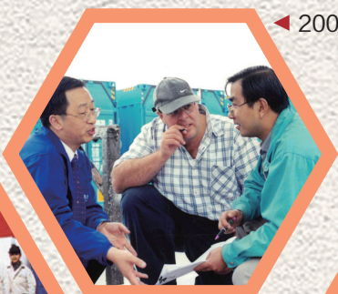
◀ 2003年罐箱公司注册成立