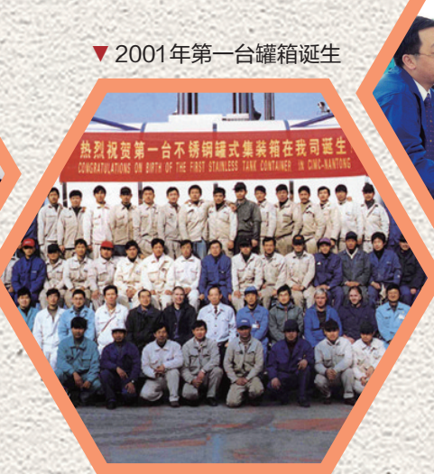
▼ 2001年第一台罐箱诞生