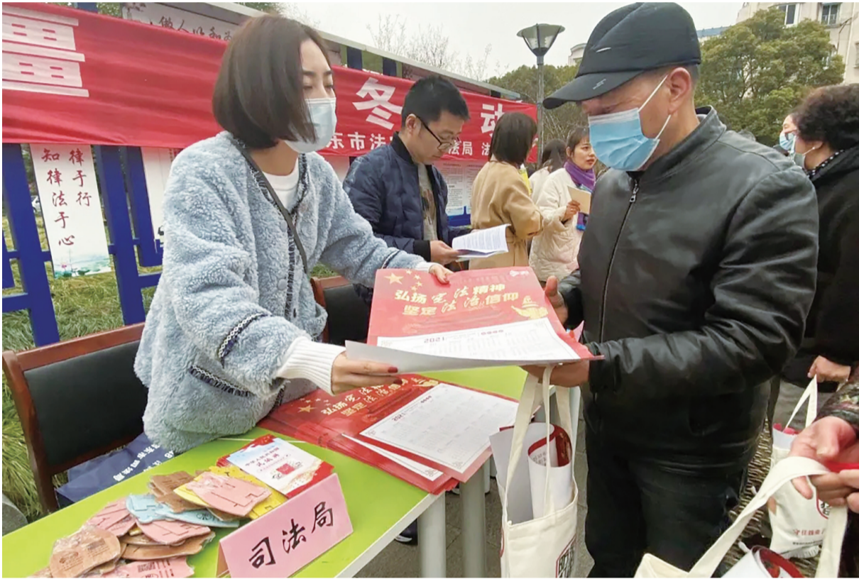
5日,启东市司法局联合启东市法学会、启东市卫健委等多家单位,共同开展送法进社区活动,通过实地发放宣传资料,向广大社区居民普及《民法典》《老年人权益保障法》等,切实提高居民群众的法治意识。