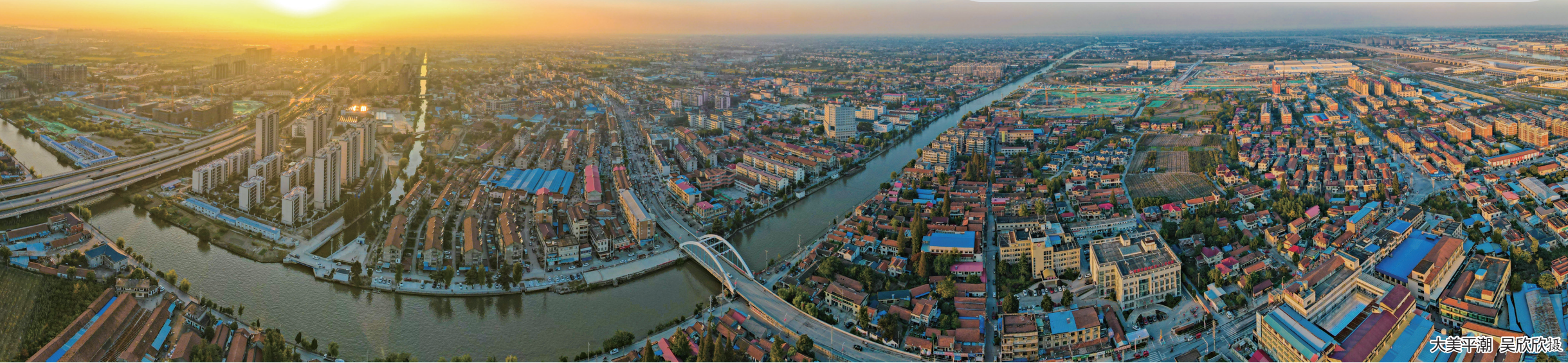
大美平潮