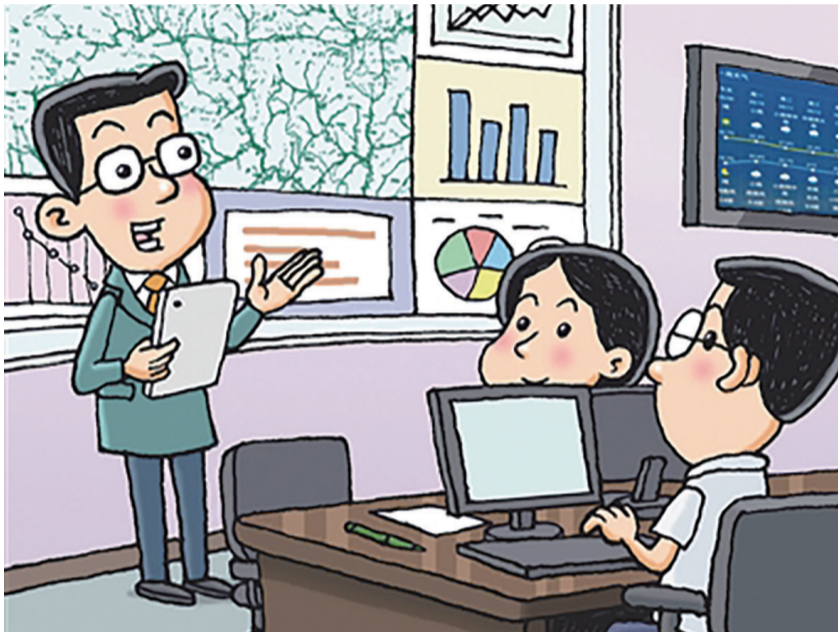
实现水位、流量、泥沙等水文要素自动监测和实时上传;水文信息通过系统的数字化整合,在终端电子大屏上实时显示,方便管理人员进行动态管理和监测……近年来,浙江杭州临安区按照“建管并重”要求,着力推进水利工程标准化管理,以数字赋能推进水利工程信息化快速发展。(据《人民日报》)

考后放松,社会各界要引导考生理性对待高考,正确面对人生。鼓励他们利用这段时间进行一些社会实践或调查,或去打工、做做志愿者,这样更有助于他们对高考后何去何从做出正确的选择。