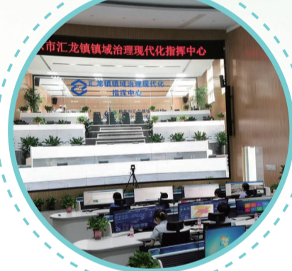
镇域治理现代化指挥中心