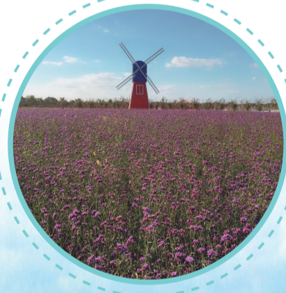
江天生态园薰衣草庄园