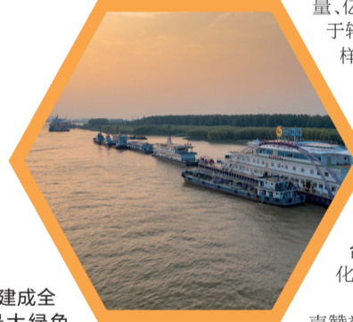
推动建成全国规模最大绿色综合服务区,为船民提供“一次靠泊、多项服务”。