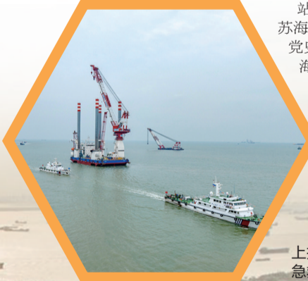
首次在风电场举行大规模海上搜救综合演习,锻炼海上搜救应急救援能力。