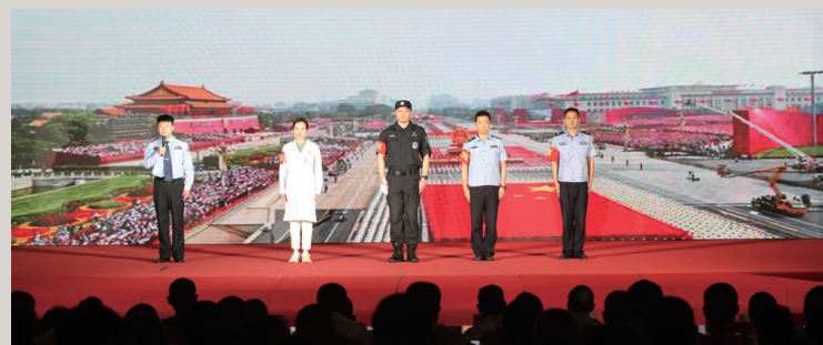
情景微党课《在磨难中崛起》