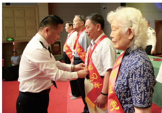
为老党员颁发“光荣在党50年”纪念章