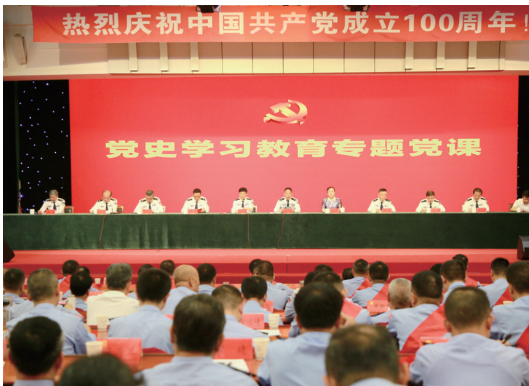
党史学习教育专题党课