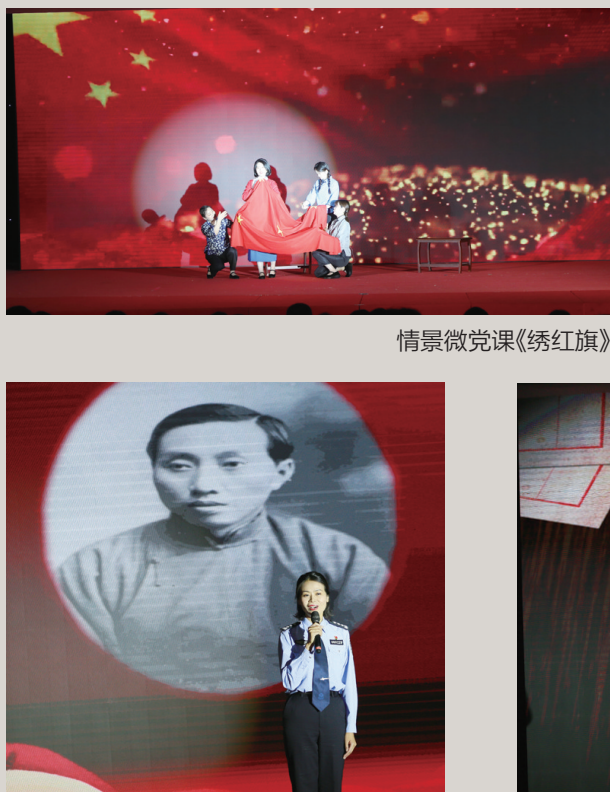
情景微党课《真理的味道》