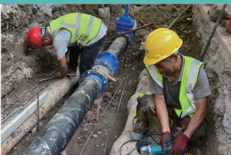
▲市水务公司施工人员冒着酷暑在光明新村实施老旧小区自来水管改造。