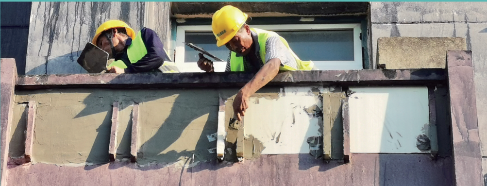
▲北濠桥新村老旧小区改造项目的建筑工人们战高温奋战在项目改造一线。