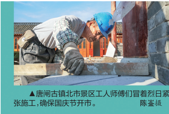
▲唐闸古镇北市区工人师傅们冒着烈日紧张施工,确保国庆节开市。