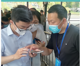
▲新城桥街道驻点志愿者冒着酷暑,在虹桥路体育馆方舱接种点开展志愿服务。