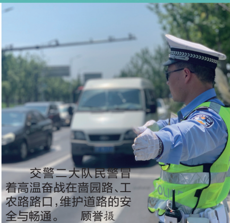
交警二大队民警冒着高温奋战在菑园路、工农路路口,维护道路的安全与畅通。