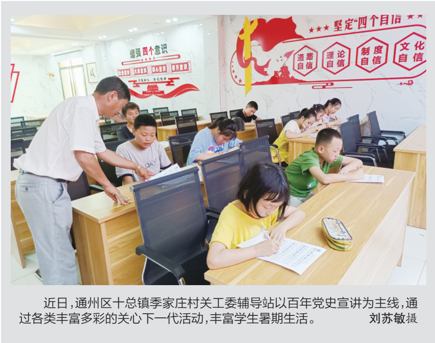
近日,通州区十总镇季家庄村关工委辅导站以百年党史宣讲为主线,通过各类丰富多彩的关心下一代活动,丰富学生暑期生活。

南莫镇有一支坚守阵地的队伍。镇新时代文明实践所充分统筹群团组织、企业机关、公益人员等各方面力量,联合驻镇单位、社会组织、劳模集体、“两新”组织、海安新青年等志愿服务分联盟,吸纳南莫本地党员、乡贤、企业家、在外能人、科技人才,组建群众身边的志愿服务支队,扩大“我们的队伍”。目前,全镇拥有“惠企纾困”“匠心筑梦”“爱心牵手”“姐妹微家”“环保卫士”“清风廉韵”“板凳课堂”“文化青墩”等10支机关青年志愿服务队与“蒲公英”“向日葵”“爱之舟”“和平鸽”等16支村级志愿服务队。这些队伍深入企业、田间、村居、机关、校园开展各类志愿服务。今年年初以来,已经开展活动192次,参与群众2000多人。