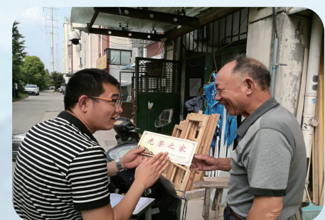
如成街道城南社区上门发放光荣牌