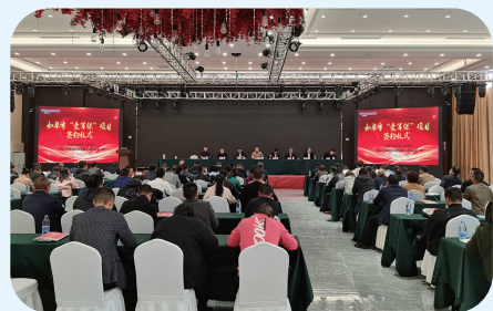
如皋市“爱军保”签约仪式