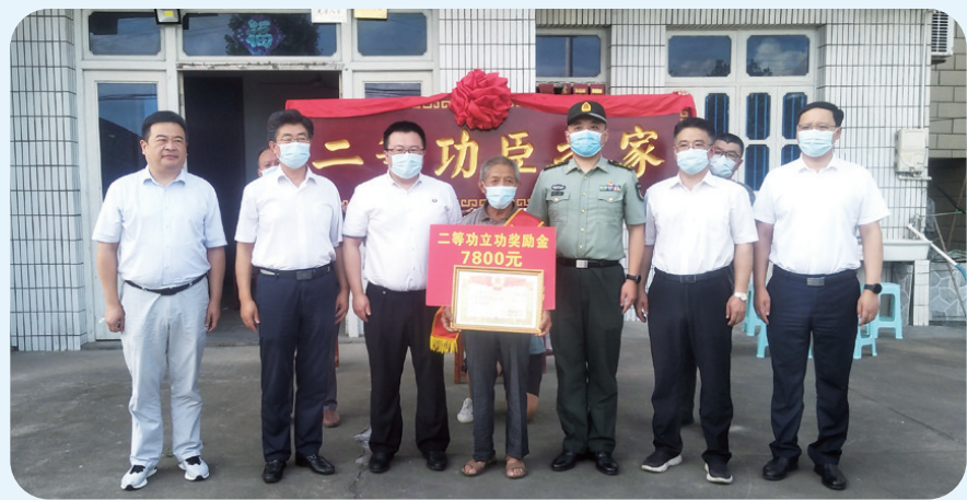
王鸣昊市长送立功喜报

4年来,如皋每年都将双拥专项经费、双拥慰问经费、义务兵家庭优待金、退役士兵培训和安置补偿金、优抚对象抚恤补助金和医疗保险金等纳入财政预算,共投入5亿元;把“慰烈工程”作为为民办实事项目,先后投资3500多万元,新建镇级烈士陵园2座,修缮烈士陵园7座、零散烈士墓441个,迁移或集中安葬零散烈士墓156个。