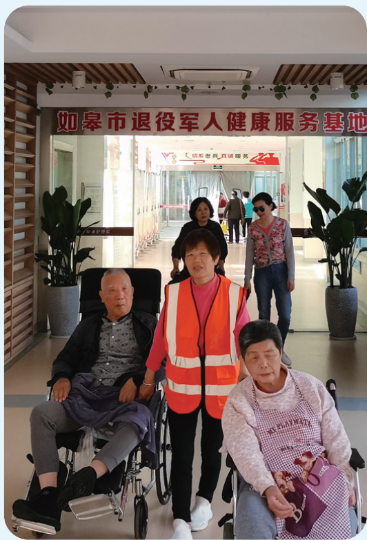
退役军人健康基地