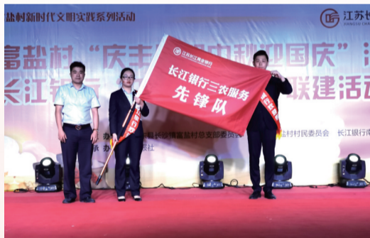
长江银行南通分行在如东富盐村成立三农服务先锋队