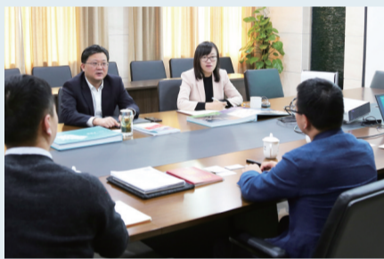
行领导深入一线服务招商引资项目

项目服务效率不仅体现在“前端”,更体现在项目报批投放的全流程。该行对时效性要求高的项目提高至“优先级”,组织精干力量为客户量身定制融资服务方案,全程跟踪进度,及时沟通解决难题。为赶时间、抢进度,服务团队经常一天内辗转三四个支行,跑五六个项目现场进行调查评估;为了让项目尽快上会报批,他们日夜兼程往返于各县(市、区)及南京、北京。对疑难项目,由一把手行长挂帅服务,充分研究产品与行业政策,创新思路确定服务方案,排除万难确保信贷支持成功落地。