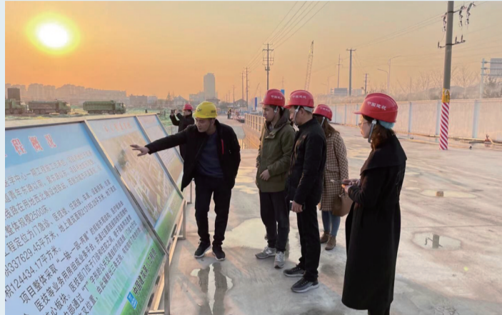
项目团队组织实地评审

重大项目融资往往具有单体金额大、个性化强、审批门槛高等特征,因此,银行机构在服务重大项目时,往往会遇到传统信贷产品审批条件难以满足,信贷规模不足以支持等难题。对此,工商银行南通分行积极发挥大行独特的产品优势,并作了许多有益的探索和创新。