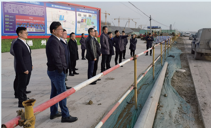
行领导查看重大项目现场

完善健全、科学有效的机制保障,是银行机构优质高效服务的基础。尤其在重大项目建设的金融服务上,一个完善的机制保障体系,往往能事半功倍。