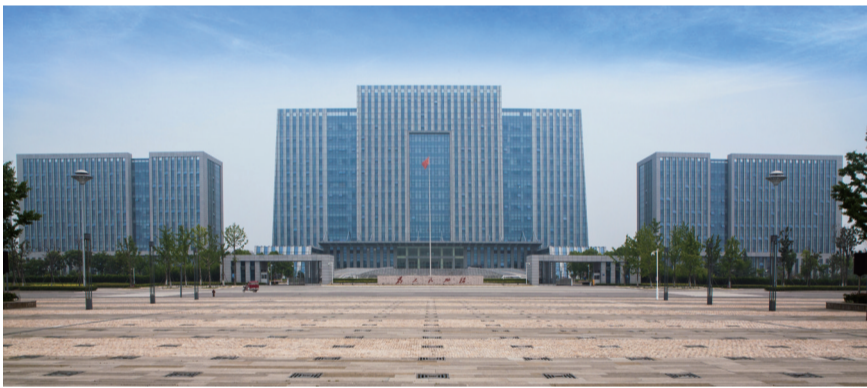
徐州市新城区写字楼——国家优质工程奖

华荣集团凭借“以人为本、以质取胜、求实进取、开拓创新”企业精神,从创办之初努力在南通站稳脚跟,到开疆扩土,在上海、南京、广州等地着力打造各区域市场的本地化团队,成立了10多家分公司,施工足迹已遍及国内100多个城市及非洲大陆,如今,华荣集团已成为集施工、研发、投资于一体的跨行业、跨区域、多元化发展的大型建筑企业集团。