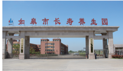
如皋市长寿养生园(爱心护理院)