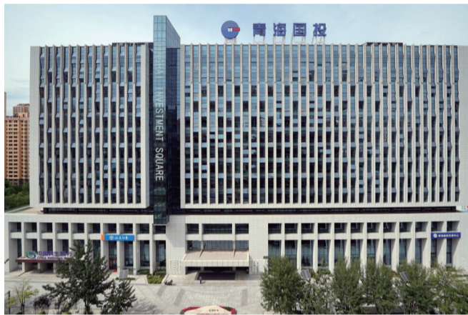
青海国投广场——鲁班奖(参建)

华荣集团适应日益变化的建筑市场,积极转型升级,利用“建筑+”的模式、“互联网+”的思维、“金融+”的手段,为客户创造价值,为社会承担责任,朝着创百年基业的企业愿景奋勇前行。