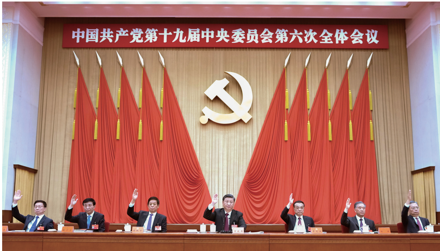
习近平、李克强、栗战书、汪洋、王沪宁、赵乐际、韩正等在主席台上。