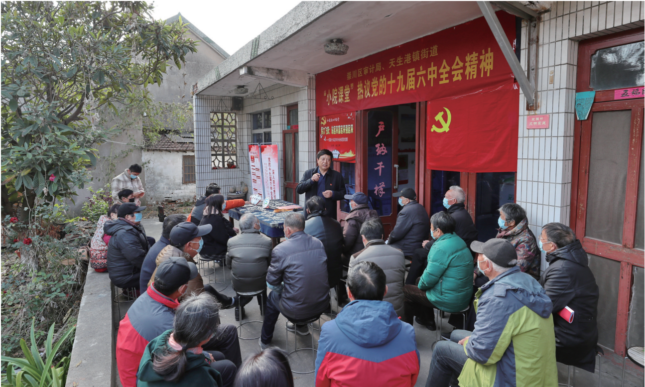
11月30日,党的十九届六中全会精神宣讲在崇川区天生港镇街道爱国村的理论宣讲阵地“小院课堂”开讲。全国“两优一先”代表、全国优秀党务工作者、全国理论宣讲先进个人姚呈明为天生港镇街道的机关干部和党员群众作生动宣讲,不断增强人民群众的“获得感”和“幸福感”。

南通医保APP与国家医保电子凭证无缝对接,覆盖全市二级及以上定点医药机构,预约挂号等9项就医购药服务和异地就医、长三角地区居外社区签约、异地人员特药待遇备案、电子对账单和照护保险单等32项业务均可“掌上办”;“互联网医院”和“互联网药店”实现医保待遇线上的直接结算,探索性率先开启了就医购药不出门、全流程不见面的“互联网+医疗+医保”服务新方式。