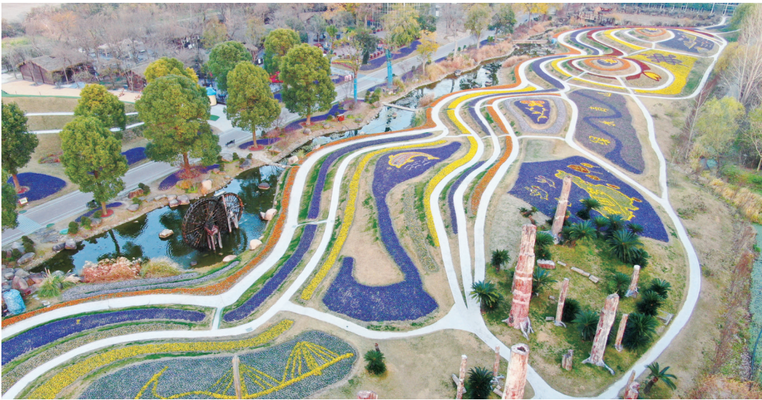
昨日拍摄的南通洲际绿博园美丽景色。重新布置的越冬花海亮相，新增了由数十万株各色小花组成的“通辽达海”“绿水青山”等景观。

本报讯（记者龚秋瑾）今年1月至11月，海门区交通事故网上数据一体化处理中心（简称“中心”）新收交通事故责任纠纷1181件，调解成功501件，调解成功率42.42%，中心成立至今调解理赔总金额累计2.3亿元。2日，在第十个“全国交通安全日”到来之际，海门法院通报了该院交通事故责任纠纷审判工作相关情况。 今年，海门法院在交通事故责任纠纷审判中创新优化举措，进一步将道路交通事故集中调解、审判工作做细做实。组建专业化团队，对纠纷进行“精调、快审”，设置工作邮箱，便于当事人24小时全天候提交案件材料，建立“一案一微信群”，保证纠纷调处“不打烊”，调解效率获得极大提高。