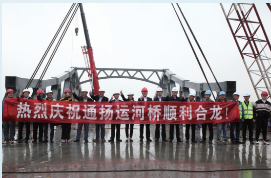
庆祝通扬运河桥顺利合龙