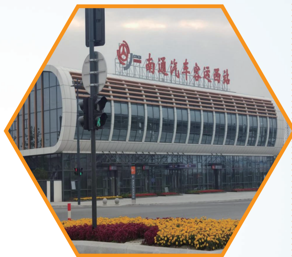
南通汽车客运西站

纵观世界级城市群发展规律，快速轨道交通是区域一体化的先决条件和关键驱动力，枢纽新城则是承接中心城市产业和功能外溢的核心载体。南通作为上海大都市圈唯一的长三角北翼城市，“高铁一环”核心成员之一，肩负承接上海辐射并向北传导带动、促进长三角更高质量一体化发展、支撑长江经济带发展的重任。平潮高铁新城将依托沪苏通铁路，成为率先对接长三角高质量一体化发展的前哨阵地，进而成为带动南通在长三角高质量一体化发展的重要抓手。