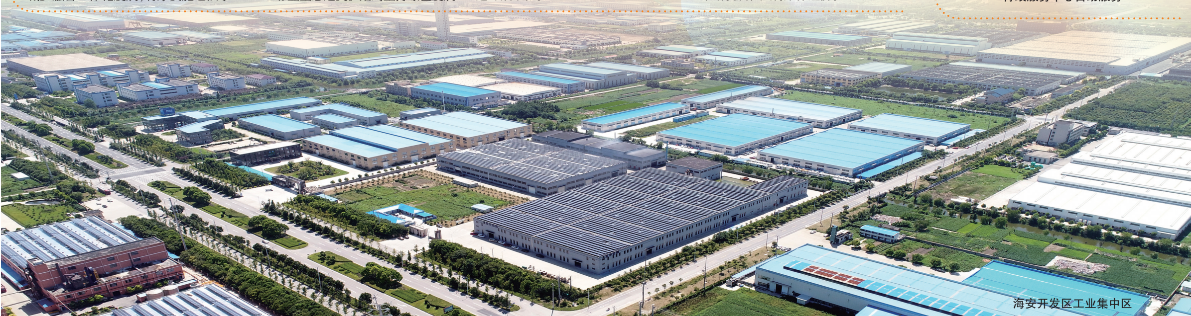
海安开发区工业集中区

建设美丽乡村。坚持以工业理念发展现代农业,持续优化农业产业结构,推动“一根丝、一条鱼、一只蛋、一滴油、一粒米”五大产业品牌化、优质化发展。深入实施乡村振兴战略,充分发挥红色村示范带动作用,着力培育乡村振兴示范村、先进村。积极培育新型合作农场、种粮大户等经营主体,发挥区域农业服务中心作用,提高现代化管理水平和经营效益。大力实施乡村建设行动,持续改善农村人居环境,打造特色田园乡村。积极推进全民创业,加大二三产项目招引力度,稳步推进集体经营性土地入市,不断发展壮大村集体经济。