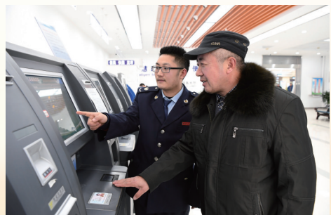
行政服务中心自助服务