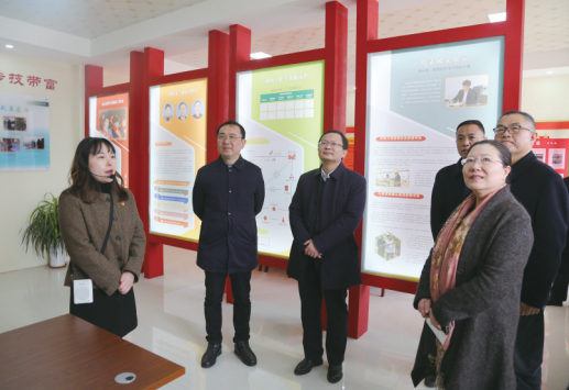
崇川区人大常委会组织观摩街道人大工作。

注重提高议案建议办理质效。对《关于传承张謇城市建设理念,再创“近代第一城”新时代辉煌的议案》办理情况,区人大常委会专题