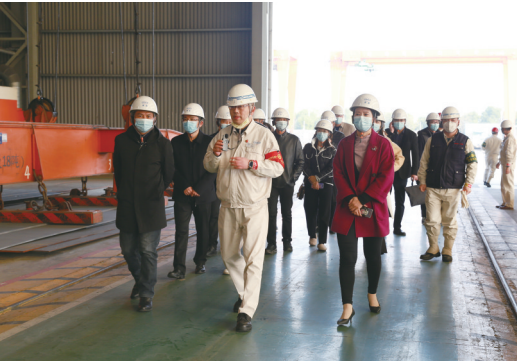
崇川区人大代表走访调研辖区企业。

组织开展专项督查和视察调研,区政府高度重视,组建了三大指挥部,制定完善了濠河、唐闸片区保护利用推进方案,空间、交通、产业等规划实施工作扎实有序推进。本届以来,共收到代表议案、建议362件,所有建议均按时办结,代表满意率和基本满意率达98%。 ·苗蓓·