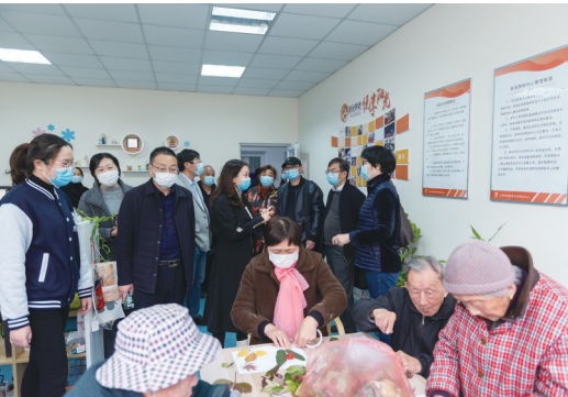
崇川区人大代表实地参观文峰街道城南二村居家养老服务中心。