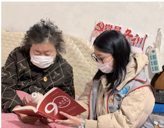
昨日,崇川区虹桥街道新中社区开展“床头党课”活动,党员志愿者上门为行动不便的老党员送书送学,做到冬训不掉队不漏学。

江苏省中医临床优秀人才研修项目旨在推进我省高层次中医临床人才培养。该项目以德业双修、医文融合、理术并重、医药兼通为主线,根据培养对象不同专业及其特点、条件,确定各具特色的研修内容,为建设我省高层次中医药人才队伍、培育新一代名中医打好基础,积蓄力量。