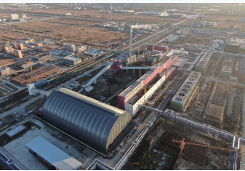
桐昆一体化项目首套聚酯装置去年12月22日试产一炮打响。

打造千亿级国家级能源岛,助力实现“双碳”目标,贡献更多“如东力量”。去年9月下旬,国家重点工程、江苏LNG三期扩建工程投产,省重大基础设施工程——江苏省液化天然气储运调峰项目开工,由华润燃气润星(江苏)能源有限公司与江苏洋口港建设发展集团共同投资100亿元的江苏如东洋口港LNG接收站项目签约落户,洋口港能源岛向年接卸周转2000万吨天然气阔步迈进。