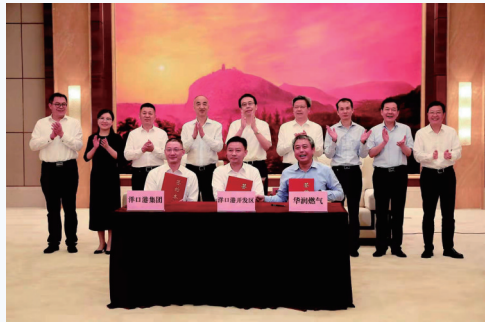
百亿级项目签约落户。

临近春节,位于洋口港经济开发区的桐昆聚酯一体化项目一期工地上,施工热气腾腾:1、2号生产线调试日夜兼程,4号生产线安装大型设备争分夺秒,5、6号生产线厂房浇筑优质高效,7、8号生产线桩基施工快马加鞭。据介绍,今年桐昆聚酯一体化项目一期部分投产,应税销售将超过100亿元。