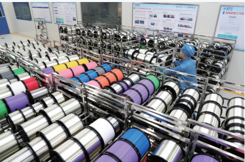
江东科技有限公司落户如东经济开发区,赋能打造百亿中天科技产业园。