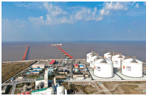
国家级能源岛展新姿。

“中国人发明了造纸,我们要建成全国乃至全世界一流的集科技、先进制造、循环经济为一体的绿色、节能、环保的科技产业基地和高档生活用纸产业园。”金光纸业项目总投资